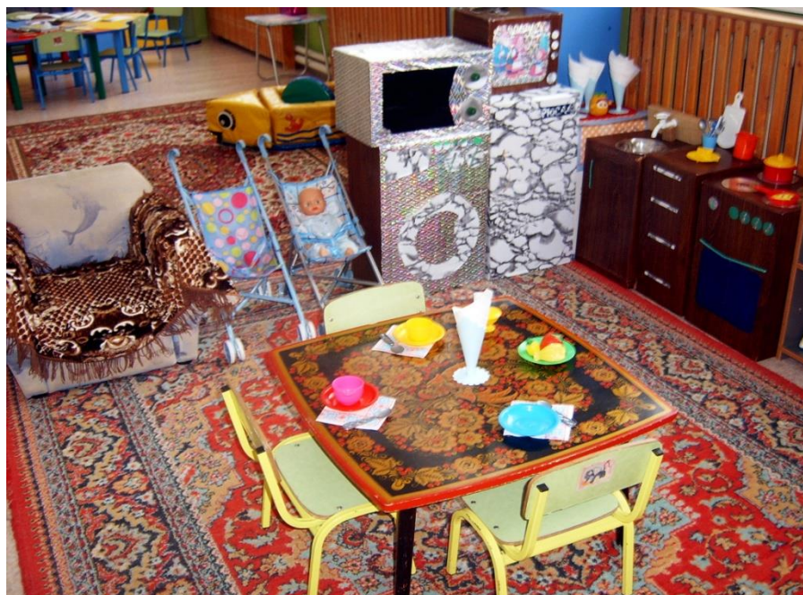
И есть зона игр для мальчиков