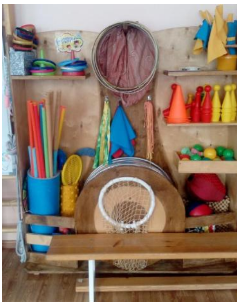
В коридоре оформили «Островок безопасности»: